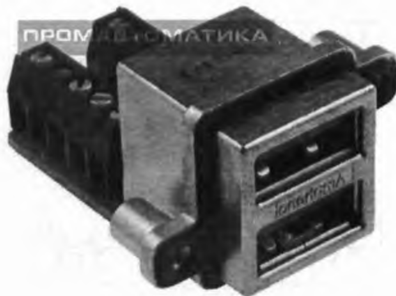
Рисунок 1 – Металевий USB рознім для монтажу на панель

Пропонується два варіанти, що зображені на рисунку 1 та рисунку 2.