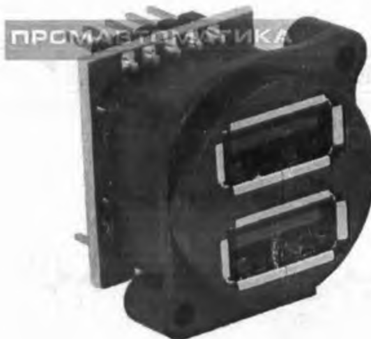
Рисунок 2 – Пластиковий USB рознім для монтажу на панель