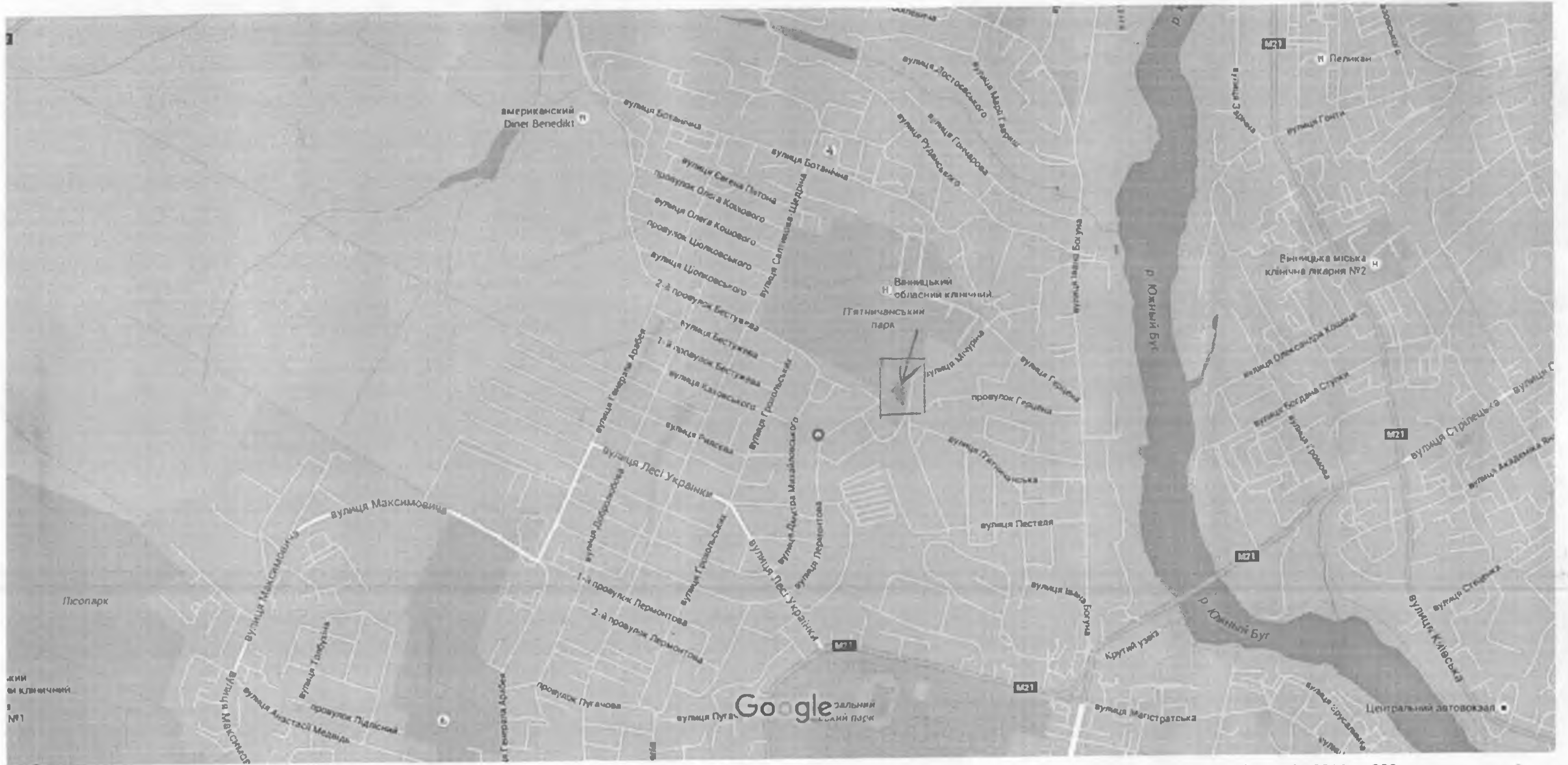
Картографические данные © Google, 2016 200 м