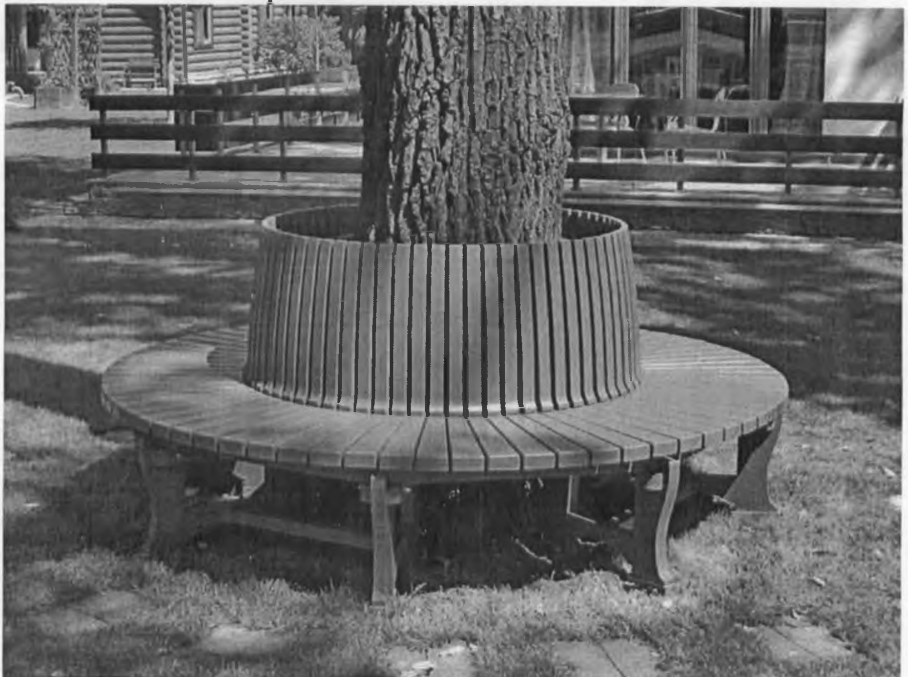
Лавка для читання та відпочинку