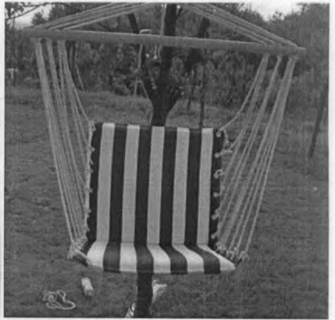
Крісло-качалка для читання