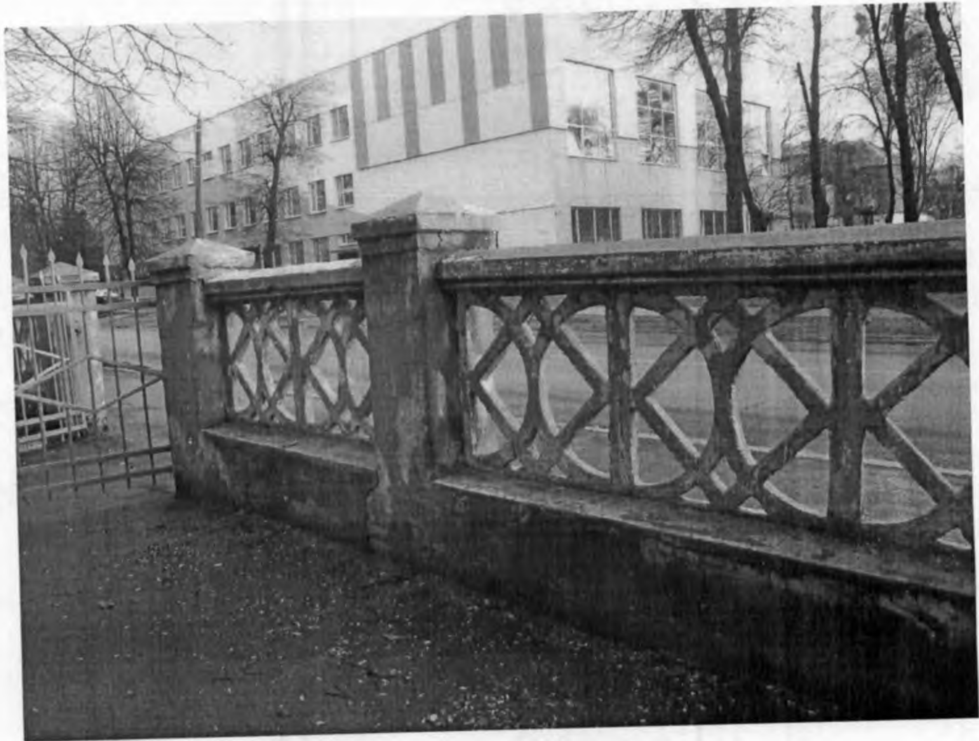
Паркан, який планується під реконструкцію