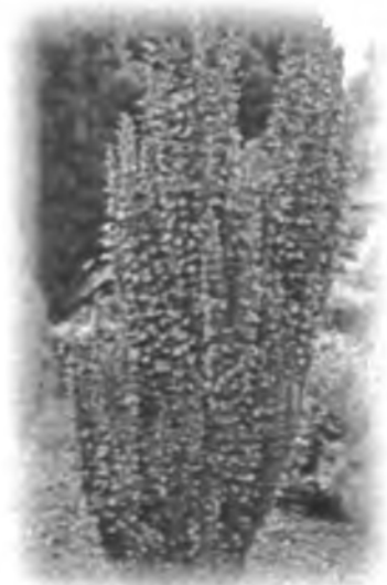
Барбарис “Helmond Pilar”