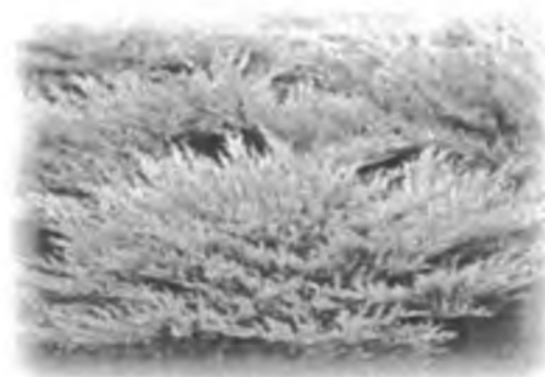
Ялівець “Andorra Compact”