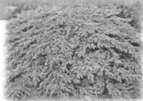
Ялівець “Green Carpet”