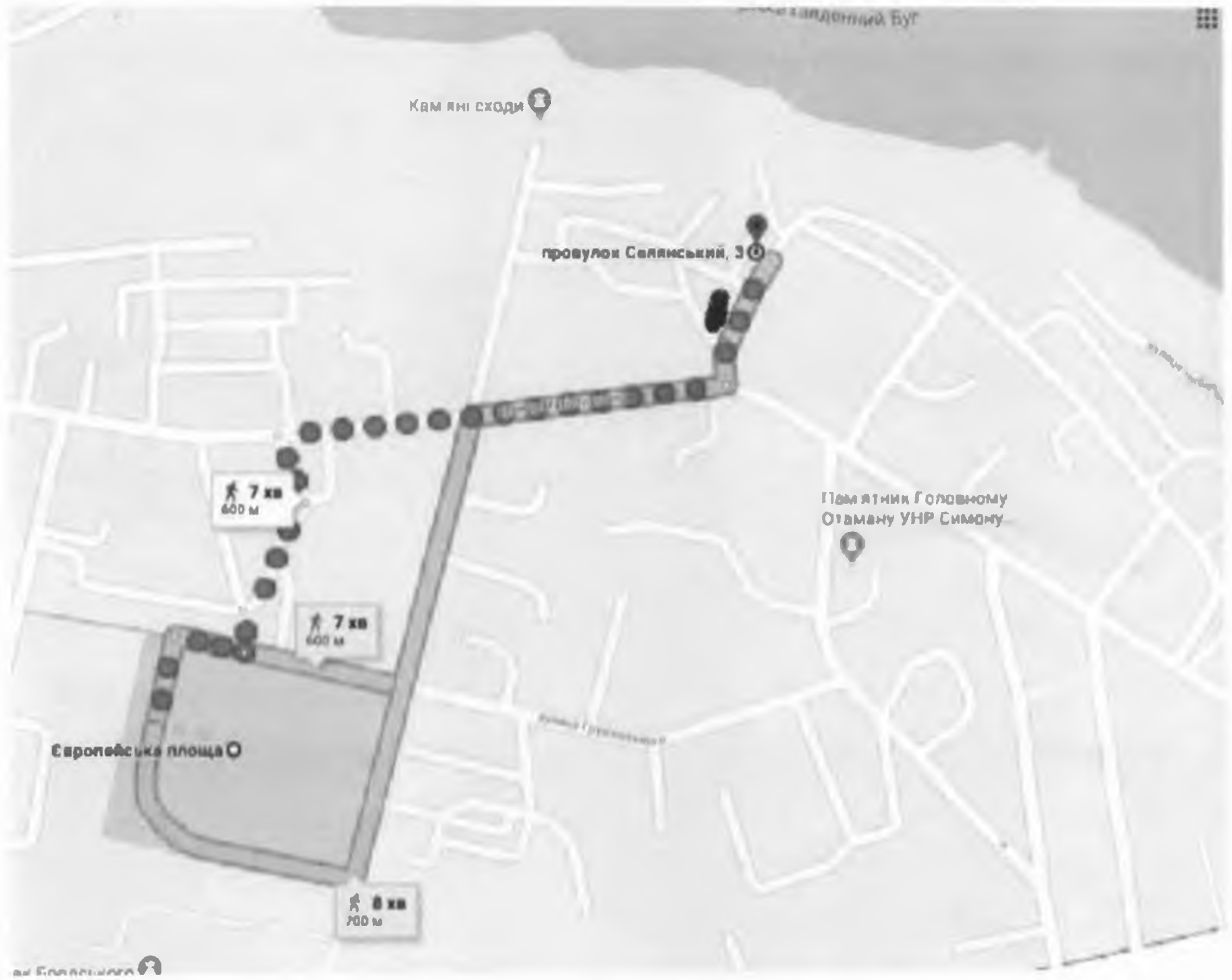
Мапа з зазначеним місцем реалізації проекту