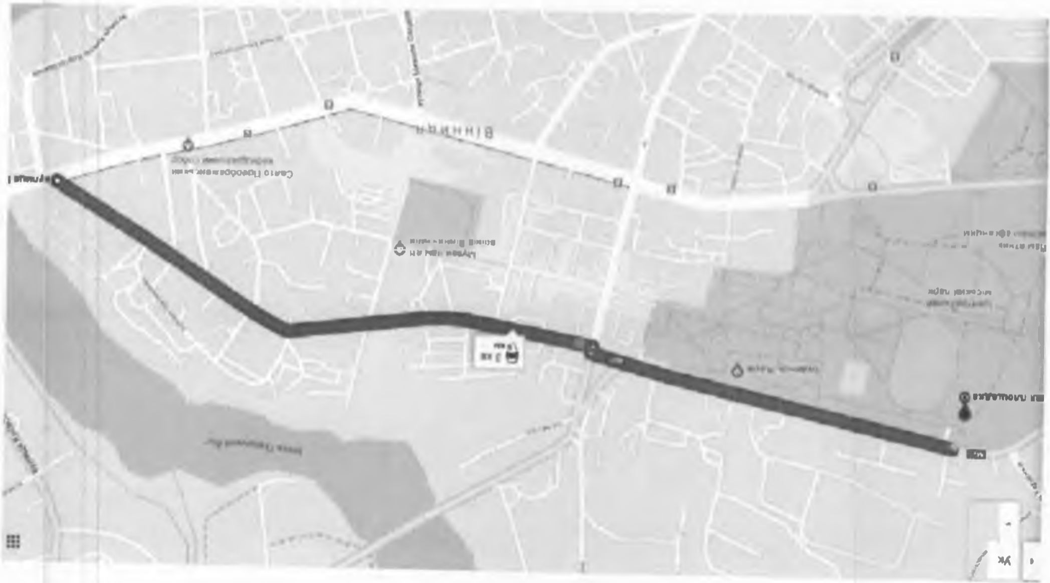
Додаток А до форми проекту Мапа з зазначеним місцем реалізації проекту