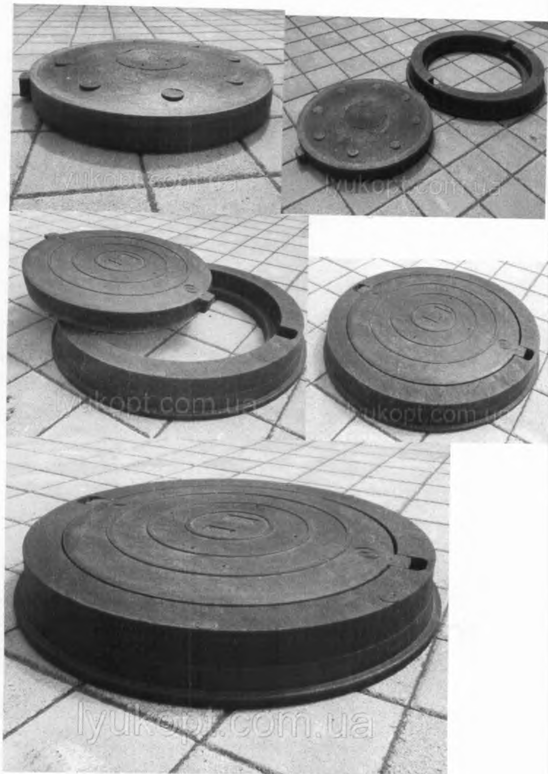
Фото Люк у комплекті